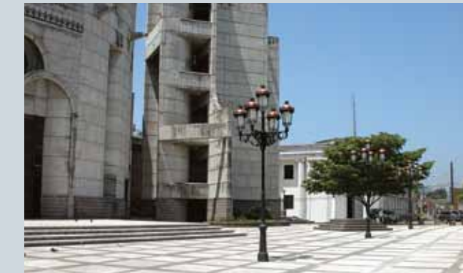
Plaza Catedral de La Vega.

* 6 - Estanco al polvo 6 - Protegido contra los chorros de agua potente ** 10 - Energía de impacto de 20 Julios