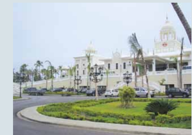
Hotel Riu Palace, Punta Cana

Si no encuentra lo que desea, en IMEXTER nos ponemos a su disposición para desarrollar, con su colaboración, el diseño que se adapte a sus necesidades.