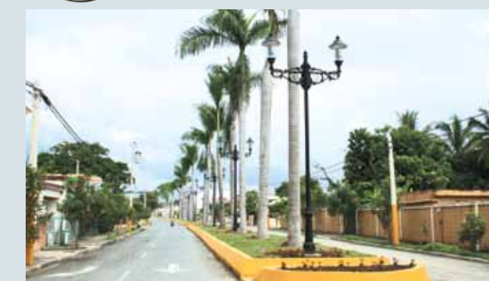
Avenida Clave, La Vega