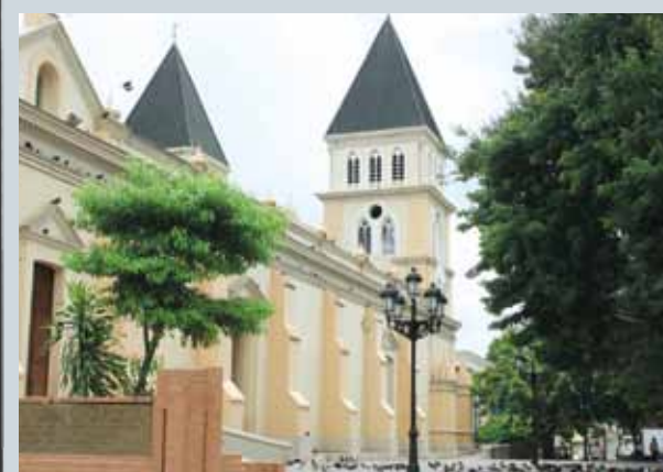
Plaza Catedral Santiago de Los Caballeros