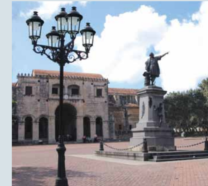
Ciudad Colonial - Plaza Catedral Santo Domingo

IMEXTER cuenta con la garantía de ATP Iluminación, empresa con más de 30 años de trayectoria en el diseño, fabricación y comercialización de productos de alta calidad. Es hoy día una empresa puntera tecnológicamente en la fabricación de luminarias y mobiliario urbano, destinado a embellecer los entornos tanto públicos como privados de viales y jardines así como aportación de seguridad a las vías públicas.