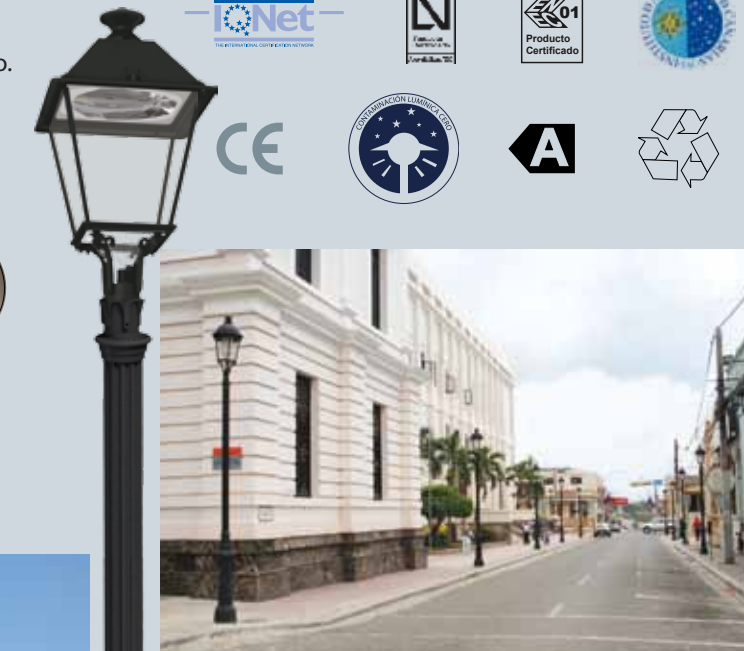
Casco histórico de Santiago de Los Caballeros