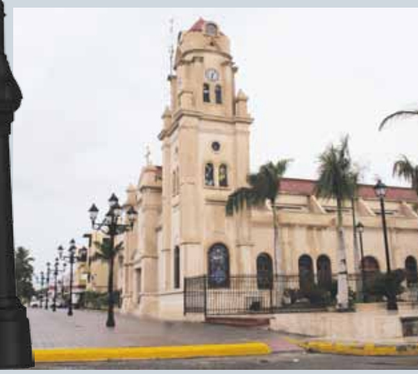
Plaza Catedral de Bani